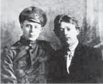
А. Ганин и С. Есенин. 1916

Прошлое и настоящее русской деревни видятся автору в пессимистических тонах.