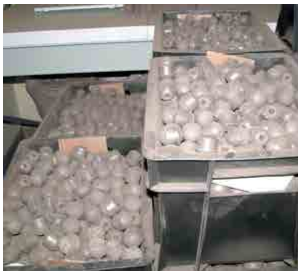
Фото 2. При посадках кукурузы применялись органические капсулы, в которых содержалось не менее 50% осадка сточных вод.

В-третьих, следует разработать технологии быстрого задерживания компоста, предотвращающего загрязнение атмосферы токсичными соединениями за счёт переноса пыли. Одним из выходов может быть применение биоматов и рулонных газонов.