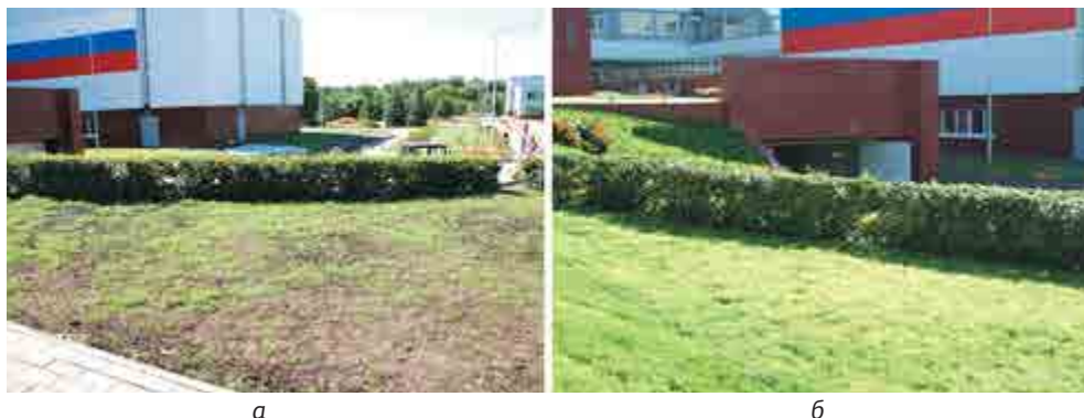
Фото 1. Газон, сформированный почвогрунтом, изготовленным с применением осадка сточных вод (а – через две недели после формирования газона в мае 2010 г.; б – в начале сентября 2010 г.)

При неблагоприятных погодных условиях внесение в почву осадков сточных вод и сооружений водоподготовки позволяет повысить устойчивость растений к засухе в связи с высокой водоудерживающей способностью такого почвогрунта.