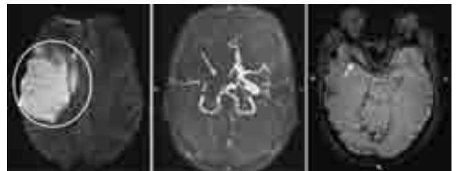
рис. 1: МРТ головного мозга пациента с ОНМК по ишемическому типу: в режиме ДВИ (слева) определяется большой очаг повышенной интенсивности МР-сигнала в правом полушарии большого мозга; на бесконтрастной МР-ангиографии (в центре) отсутствует сигнал от кровотока по правым ВСА и СМА (стрелкой указана проекция правой СМА); в режиме SWI (справа) в проекции правой СМА наблюдается понижение интенсивности МР-сигнала, что соответствует внутриартериальному тромбу (указано стрелкой).

Особую значимость применение данной методики приобретает в ряде заболеваний, сопровождаемых избыточным накоплением железа (болезнь Паркинсона, хоря Гентингтона, болезнь Альцгеймера, рассеянный склероз,