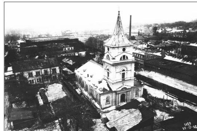
Рис. 1. Здание лютеранской церкви на территории ЦАГИ.

а ее помещение передано ЦАГИ 9 . Фотография церкви, датированная 28 марта 1928 г., представлена на рис. 1 10 .