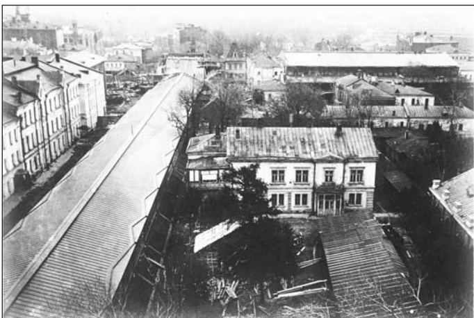
Рис. 3. Часть территории ЦАГИ (1927 г.).

Собранные материалы о евангелическо-лютеранской церкви святого Михаила были опубликованы в журнале «Всеобщая история» 19 , а также вошли в состав монографии автора «Развитие отечественного авиационного неметаллического материаловедения в 1922–1932 гг. Неизвестные страницы истории в архивных документах», рукопись которой была рекомендована к печати решением Ученого совета Института истории естествознания и техники имени С. И. Вавилова Российской академии наук (ФГБУН ИИЕТ РАН) 12 ноября 2013 г.