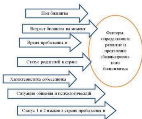
Рис. 1 Факторы, определяющие развитие и проявление сбалансированного билингвизма

Рамки статті дозволяють представити способи оцінювання стану лінгвокультурного розвитку дошкільників наблюдение і опросные листы лише кількома найбільш популярними їх видами. Ці способи використовуються батьками і педагогами в тому випадку, якщо немає можливості провести формалізоване тестування. Наблюдения індивідуального процесу фізичного, психічного і речевого розвитку дитини документуються (наприклад, на сторінках календаря-портфоліо білінгва, в розділі «Портфоліо комунікацій»). Ураховуючи, що розвиток дітей (особливо білінгвів) і процедури його вимірювання визначаються як зовнішні (час перебування в еміграції, статус батьків, ситуація спілкування і др. (см. рис. 1)), так і внутрішні факторами (фізіологічним, психологічним, психосоматичним і др.), ці способи слід використовувати системно. Нижче приводиться малюнок, що відображає фактори розвитку і проявлення білінгвізму дитиною.