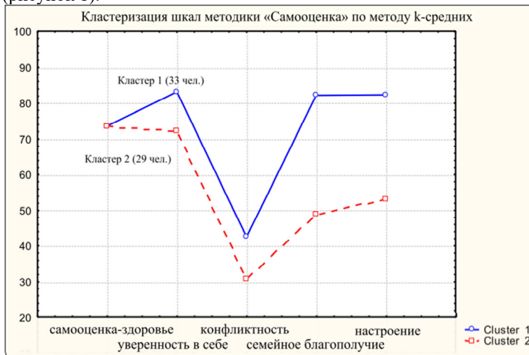
Рисунок 1 – Результаты кластерного анализа по шкалам теста «Самооценка» – данные актуальной самооценки

С целью выделения групп пациентов в соответствии с особенностями их самооценки и уровня притязания проведен кластерный анализ по методу Уорда. По результатам кластеризации данных актуальной самооценки выборка пациентов была разделена на две группы (рисунок 1).