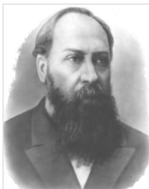
Сергей Иванович Коржинский