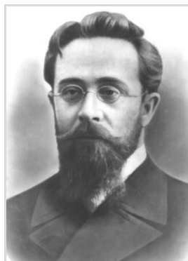
Андрей Яковлевич Гордягин

изменчивости растений. Н.Ф. Леваковский также проводил опыты с целью выяснения взаимоотношений между растениями при их совместном произрастании. В частности, он выяснил экологически обусловленные отношения между сосной и березой в процессе зарастания вырубок и пожарищ. Таким образом, Н.Ф. Леваковский своими исследованиями заложил основы экологической физиологии растений [3], экспериментальной экологии растений и экспериментальной фитоценологии [4–6], а также экспериментальной морфологии растений [3, 7].