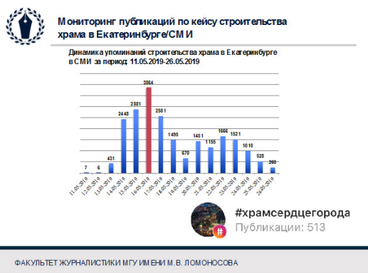
Рис. 2. Данные мониторинга публикаций по кейсу «Екатеринбург».

общественной сфере религии, но в то же время демонстрирует проявление характеристик гражданского общества. 13 мая 2019 года жители Екатеринбурга вышли на «мирный протест» против строительства храма святой Екатерины в городском сквере. Мониторинг публикаций в официальных средствах массовой информации показал (рис. 2), что наибольшее число упоминаний ситуации (ключевое слово — «Храм в Екатеринбурге») было зафиксировано 16 мая 2019 года, в день, когда президент РФ Владимир Путин предложил провести опрос по поводу необходимости строительства храма (число упоминаний — 3864). Кроме того, в социальных сетях был запущен флешмоб: сторонники возведения храма публиковали фотографии с хештегом #ХрамСердцегорода (более 500 публикаций в Instagram). Появление хэштега в ответ на спорную для общества ситуацию демонстрирует первые признаки медиаактивности молодежи.