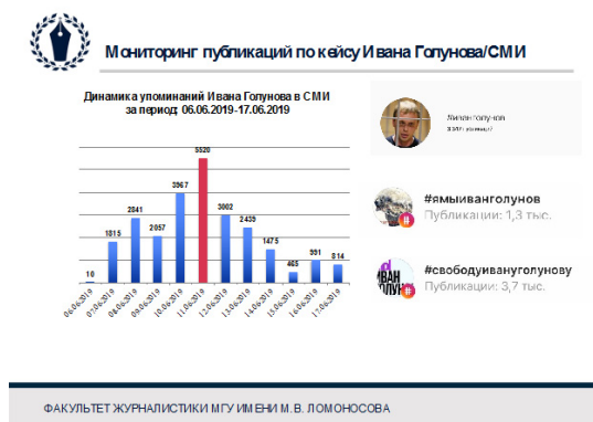
Рис. 3. Данные мониторинга публикаций по кейсу «Дело Голунова».

подозрению в сбыте наркотических веществ. На следующий день было возбуждено уголовное дело, а 8 июня 2019 года Голунову был назначен домашний арест до 7 августа. Пик упоминаний журналиста в официальных средствах массовой информации (ключевое слово — «Иван Голунов») был зафиксирован 11 июня 2019 года (количество упоминаний — 5520), когда уголовное дело Голунова было прекращено в связи с недоказанностью его участия в совершении преступления (рис. 3). В социальных сетях были запущены хэштеги #ямыиванголунов, #свободуиванголунову, #иванголунов, общее количество публикаций по которым в социальной сети Instagram составило 8420.