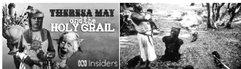
Рис. 2 Обложка сатирического видео и сцена из оригинального фильма, где король Артур побеждает Черного Рыцаря, отрубая ему руки и ноги

В 2017 году в интернете появился сатирический видеоролик (рис. 2), представляющий собой нарезку из предвыборных выступлений Терезы Мей, наложенных на видеоряд из фильма “Monty Python and the Holy Grail”, показывающих ее неспособность получить большинство голосов партии на выборах в парламент и убедить в правоте своих политических позиций. Вспомним, что именно эта ассоциация была одной из первых, согласно данным словаря ассоциаций. В 2017 году результаты выглядят очень неоднозначными: консерваторы получили в парламент 319 мест, а лейбористы — 261. С одной стороны, это была формальная победа, если не знать, что выборы были досрочными, рассчитанными на то, чтобы получить абсолютное большинство голосов, что казалось важным шагом в уменьшении влияния оппозиции на переговоры в Брюсселе по Брекситу. Проблема заключалась в том, что до досрочных выборов у консерваторов было 330 голосов при 326 необходимых для формирования правительства.