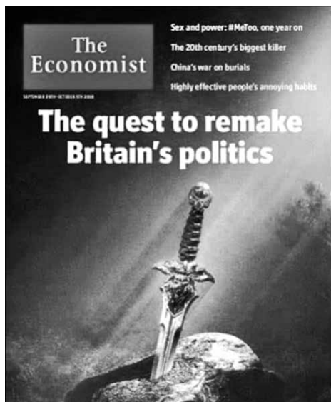
Рис. 4 Обложка журнала «The Economist», 2018 год

thousand years ” (Я прекрасно спал, когда вся эта чертова чушь Брексита разбудила меня. Я ожидал проспать еще, по крайней мере, тысячу лет) [The Spooof, 2018, Nov, 18]. С течением времени таких прямых сравнений становится меньше. Чаще читателям позволяется додумать сравнение и возможный выход из кризиса самостоятельно. Желание лёгкого и почти магического выхода из сложившейся ситуации подается иронично и неправдоподобно, а ищущие его сравниваются с рыцарями-паломниками: Some magic new solution that might — maybe, possibly — provide a sudden surprise solution to Brexit’s conundrums, in the way exhausted pilgrims might fall jubilantly on the Holy grail proclaiming, at last, that its jewels are beyond compare and a world changing treasure is now in their heroic clutches (Необходимо какое-то волшебное новое решение, которое могло бы — может быть — возможно — сможет обеспечить неожиданное удивительное разрешение неразрешимой дилеммы Брексита , похожим образом как изможденные паломники могли бы неистово ликовать узрев Святой Грааль , заявляя, наконец, что его сокровища несопоставимы и что они теперь крепко держат в своих героических лапах святыню, изменяющую мир ) [BBC, 2019, Jan, 20].