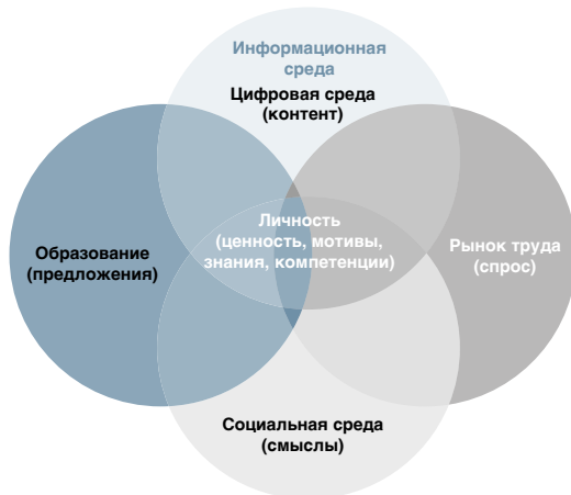
Рис. 1. Модель формирования профессиональной культуры личности

рынок труда (компании, госучреждения, самозанятость и др.). Цифровые коммуникации являются каналами донесения и обмена сообщениями, составляя все более значимую часть информационной среды. Данные факторы задают исследовательскую рамку и отражены в модели на рисунке 1.