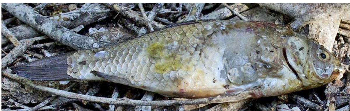
Рис. 8. Карась серебряный Carassius gibelio – основной объект питания серых цапель из колонии у села Козьмодемьяновка. 21 июня 2017.

Питание гнездовых птенцов цапель изучалось по корму, обронённому цаплями во время кормления птенцов и собранному на земле под гнездовыми деревьями. Кормовые компоненты были собраны 14, 21 и 25 июня 2017. Всего собрано 37 экз. кормов, из них: карась серебряный Carassius gibelio – 23 экз. (62.1%), ротан-головёшка Percottus glenii – 7 экз. (18.9%), вьюн Misgurnus mohoity – 4 экз. (10.8%), амурский сом Parasilurus asotus – 1 экз. (2.7%), полёвка Microtus sp. – 1 экз. (2.7%), детёныш ондатры Ondatra zibethica – 1 экз. (2.7%).