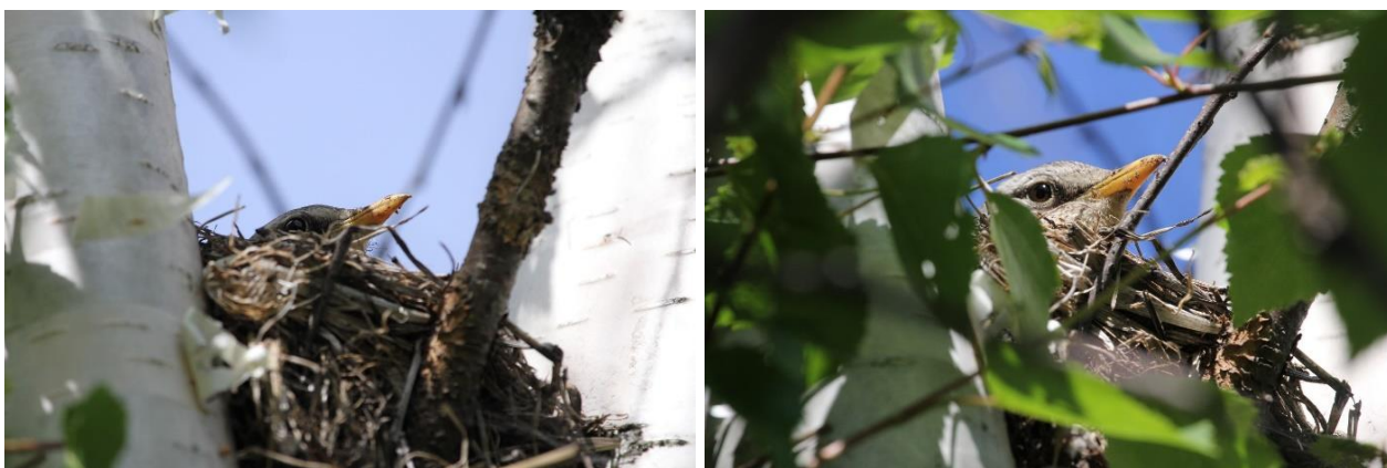
Рис. 3. Самка рябинника Turdus pilaris , насиживающая кладку. Окрестности Архангельска. 14 июня 2019.

Подростие птенцы большой синицы громко пищат при полёте взрослых и в момент самого кормления. На эти частые прилёты взрослых синиц и крики птенцов насиживавшая кладку самка рябинника не отвлекалась. Так продолжалось весь период насиживания кладки рябинниками, несмотря на разную суточную активность этих видов. К концу периода выкармливания птенцов большими синицами у рябинников вылупились птенцы. Таким образом выкармливание птенцов у