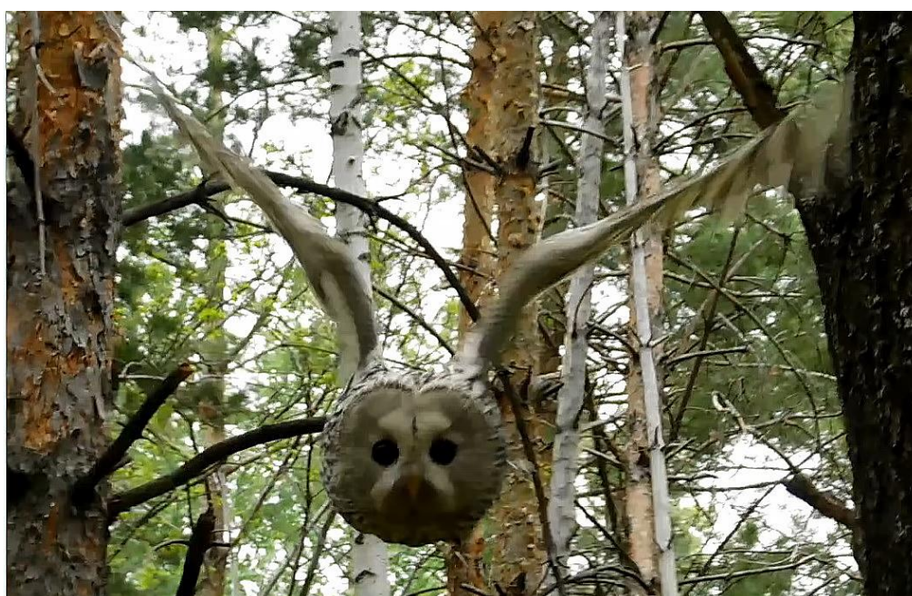
Рис. 3. Длиннохвостая неясыть Strix uralensis во время атаки.