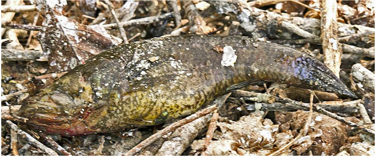
Рис. 10. Ротан-головёшка Percottus glenii . 21 июня 2017.