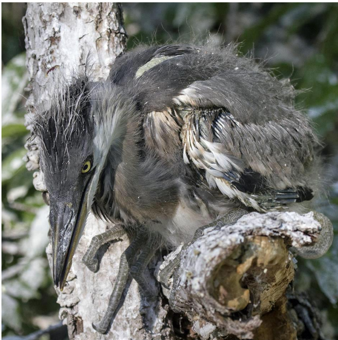
Рис. 14. Птенец серой цапли Ardea cinerea , изгнанный из гнезда.

В осмотренных 31 гнезде цапель, выбранных случайным методом на трансекте, пересекающей колонию с юго-востока на северо-запад, незадолго до вылета птенцов из гнёзд, в 5 (16.1%) было 4 птенца, в 8 (25.8%) – 3, в 14 (45.2%) – 2 и в 4 гнёздах (12,9%) – 1 птенец. В 2017 году в гнёздах серых цапель перед вылетом птенцов преобладали выводки с 2 и 3 птенцами. В гнёздах, находящихся в центральной части колонии, птенцов было больше, чем в гнёздах, устроенных на периферии колонии.