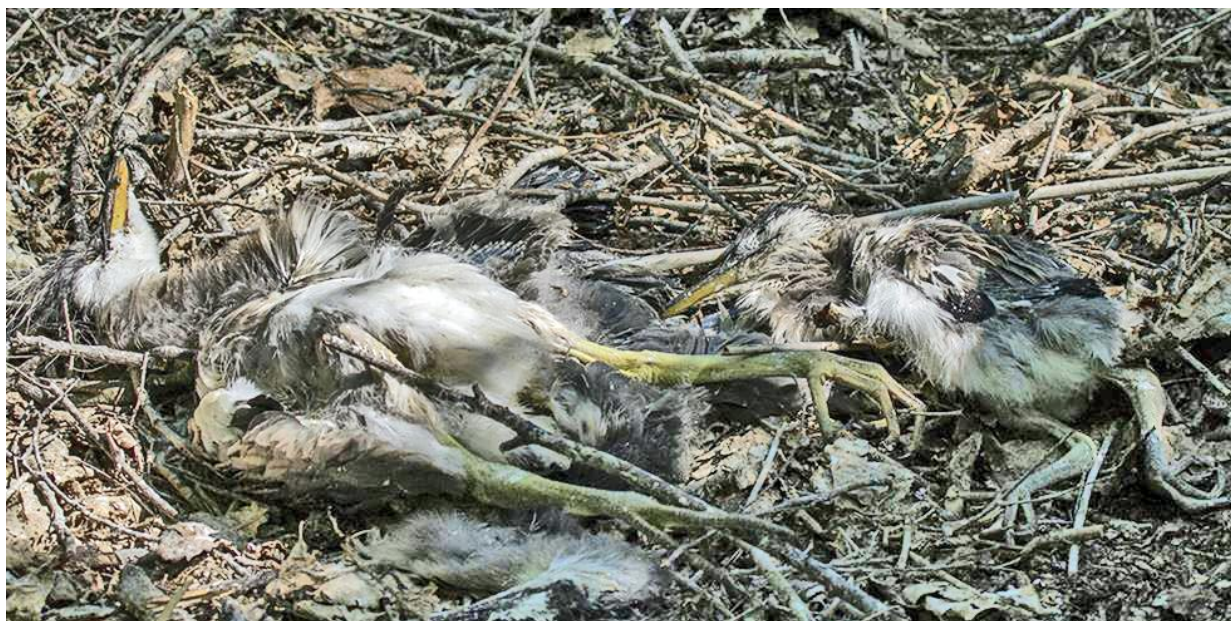
Рис. 2. Трупы птенцов серой цапли из одного выводка, выпавших из гнезда во время штормового ветра. 5 июня 2017.

лесного массива может быть и ветровой режим юга Зейско-Буреинской равнины. В течение года на равнине преобладают ветра северо-западного направления (до 70%). Весной, в апреле-мае, и в начале лета средние месячные скорости ветра составляют 4-5 м/с, а в отдельные дни скорость ветра достигает 20 м/с (Коротаяев 1974). Размещение колонии в глубине лесного массива способствует защите гнёзд от разрушающего действия штормового ветра, который, пройдя над широкой полосой крон деревьев разной высоты, растущих перед колонией, снижает свою скорость. Тем не менее, сильные ветра оказывают пагубное воздействие на сохранность гнёзд в колонии и их содержимое. Так, 28 мая 2017 юг равнины подвергся штормовому ветру, скорость которого, по данным Гидрометцентра, достигала 18 м/с. Колония цапель, подвергшаяся воздействию ураганного ветра, была осмотрена мною 5 июня 2017. Несмотря на то, что деревья, окружающие колонию, несколько ослабили силу ветра, ветви, на которых находились массивные гнёзда цапель, не выдержали напора ветра и обломились. На земле под гнездовыми деревьями возвышались кучи сухих веток – обрушившиеся гнёзда цапель, лежали трупы погибших птенцов (рис. 2).