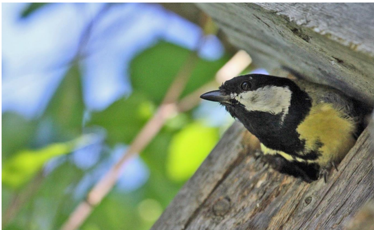
Рис. 5. Самец большой синицы Parus major , вылетающий из синичника после кормления птенцов. Окрестности Архангельска. 14 июня 2019.