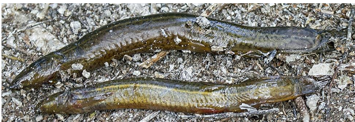
Рис. 9. Вьюн Misgurnus mohoity – один из немногих объектов питания серых цапель из колонии у села Козьмодемьяновка. 25 июня 2017.