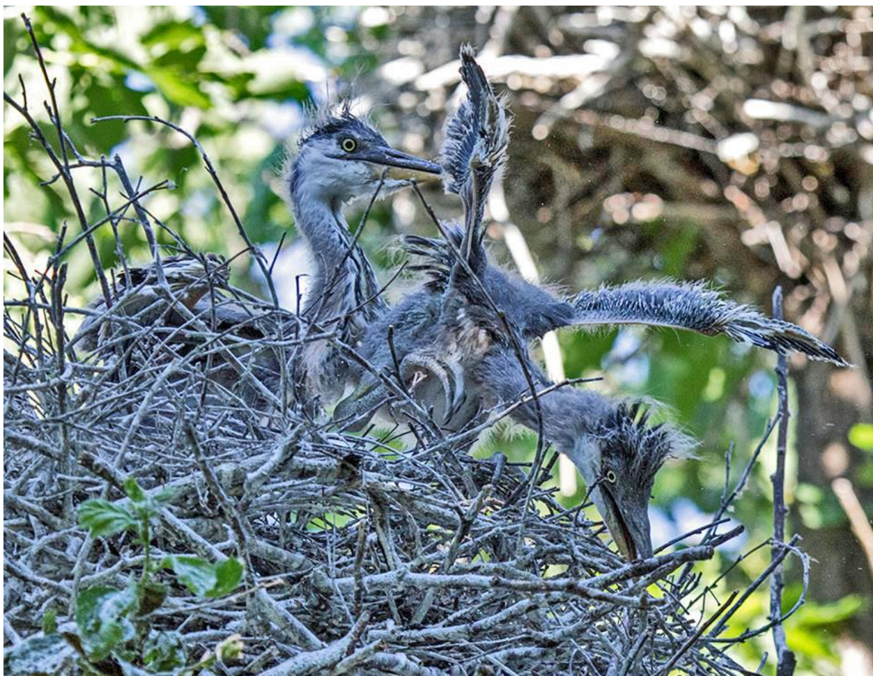
Рис. 13. Старший в выводке птенец серой цапли Ardea cinerea изгоняет из гнезда младшего птенца.

В наблюдаемой колонии серых цапель гибель птенцов в выводках часто происходит по причине конкуренции за пищу. При недостатке пищи старшие птенцы активно преследуют младших, нанося им удары клювом в голову, туловище, крылья. Младшие птенцы, спасаясь от нападений старших птенцов, покидают гнёзда и взбираются на ветки дерева, расположенные рядом с гнездом. Птенцы, вынуждено покинувшие гнёзда, остаются без корма, слабеют и падают на землю, где вскоре умирают. В гнёздах цапель, где птенцы ещё не способны лазать по ветвям либо рядом с гнездом нет подходящих для лазания ветвей, изгнание маленьких птенцов разрешается иным способом. Старший птенец атакует младшего, нанося ему сильные удары клювом, стараясь вытеснить его на край гнезда. Птенца, очутившегося на краю гнезда, старший птенец хватает за крыло или шею, и выбрасывает из гнезда (рис. 13, 14). Младшего птенца в выводке могут одновременно преследовать два старших птенца. Один из родителей, находящийся у гнезда, спокойно наблюдает за происходящим, не предпринимая никаких действий по защите птенца, преследуемого собратьями.