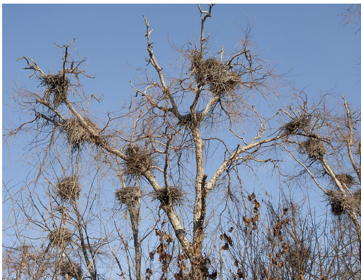
Рис. 6. Гнёзда серых цапель на даурской берёзе.