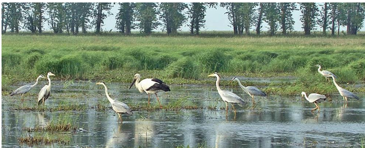
Рис.12. В поисках рыбы серые цапли Ardea cinerea сопровождают кормящегося дальневосточного аиста Ciconia boyciana .

При охоте на рыб серые цапли весьма эффективно добывают корм в местах кормёжки дальневосточных аистов Ciconia boyciana . В отличие от цапель, аисты на мелководьях добывают корм, активно перемещаясь. Погрузив клюв в воду, они делают движения головой влево-вправо, при этом часто-часто работают клювом (как это делают кряквы), прощупывая толщу воды. Заметив кормящегося поблизости аиста, серые цапли незамедлительно перелетают к нему, и 3-5 птиц, окружив аиста, перемещаются вслед за ним (рис. 12). При этом цапли хватают рыб, вспугнутых кормящимся аистом.