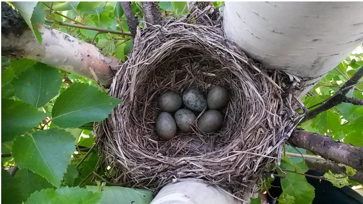
Рис. 2. Гнездо рябинника Turdus pilaris , расположенное над гнездом большой синицы Parus major в синичнике. Окрестности Архангельска. 14 июня 2019.

5 июня гнездо рябинников было пустым, а 8 июня самка уже сидела на гнезде. По-видимому, насиживать она начала после откладки 3-го или 4-го яйца, т.к. полная кладка состояла из 6 яиц (рис. 2). Во время насиживания самкой рябинника кладки (рис. 3) синицы продолжали активно кормить птенцов (рис. 4, 5).