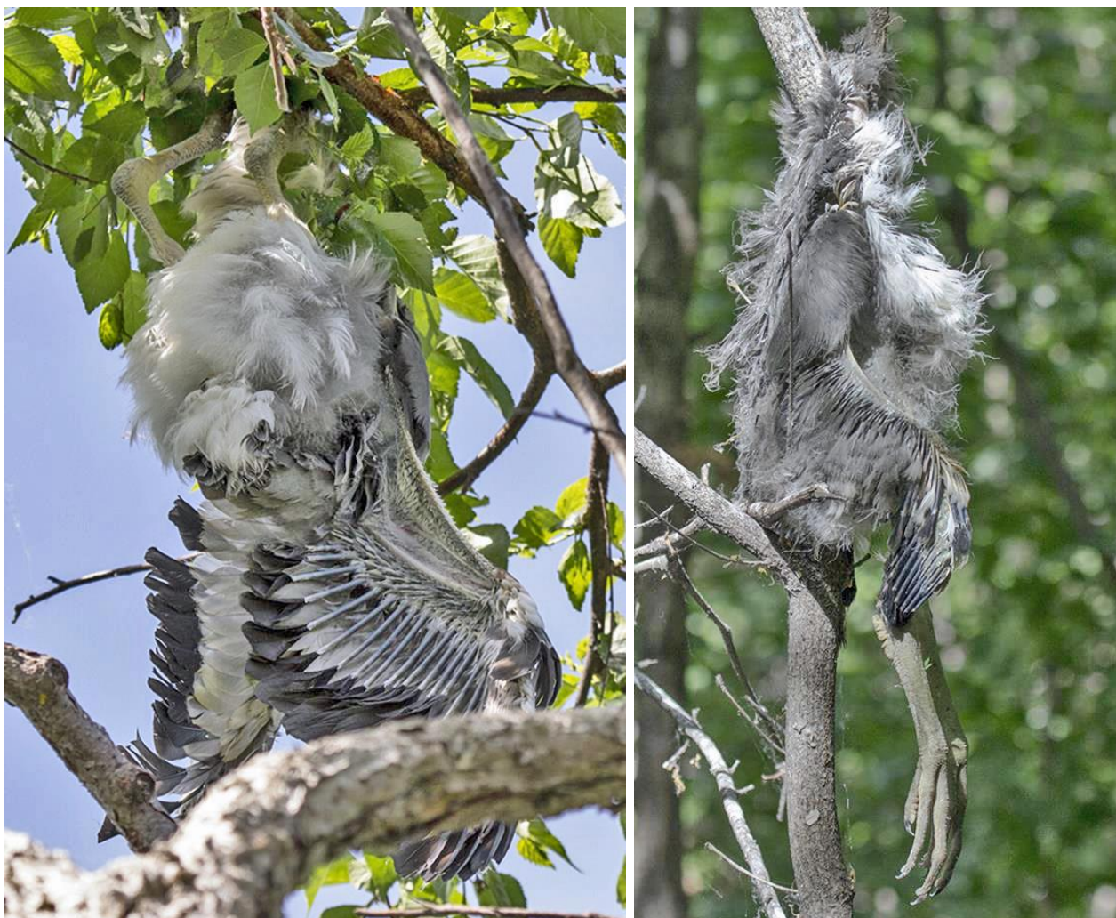
Рис. 3 (слева). Труп птенца серой цапли, выпавшего из гнезда во время штормового ветра.

даемой колонии цапли-родители не кормили выпавших из гнёзд птенцов. Со временем птенцы, упавшие на землю в силу обстоятельств, умирают от голода либо становятся лёгкой добычей четвероногих хищников, регулярно посещающих колонию.