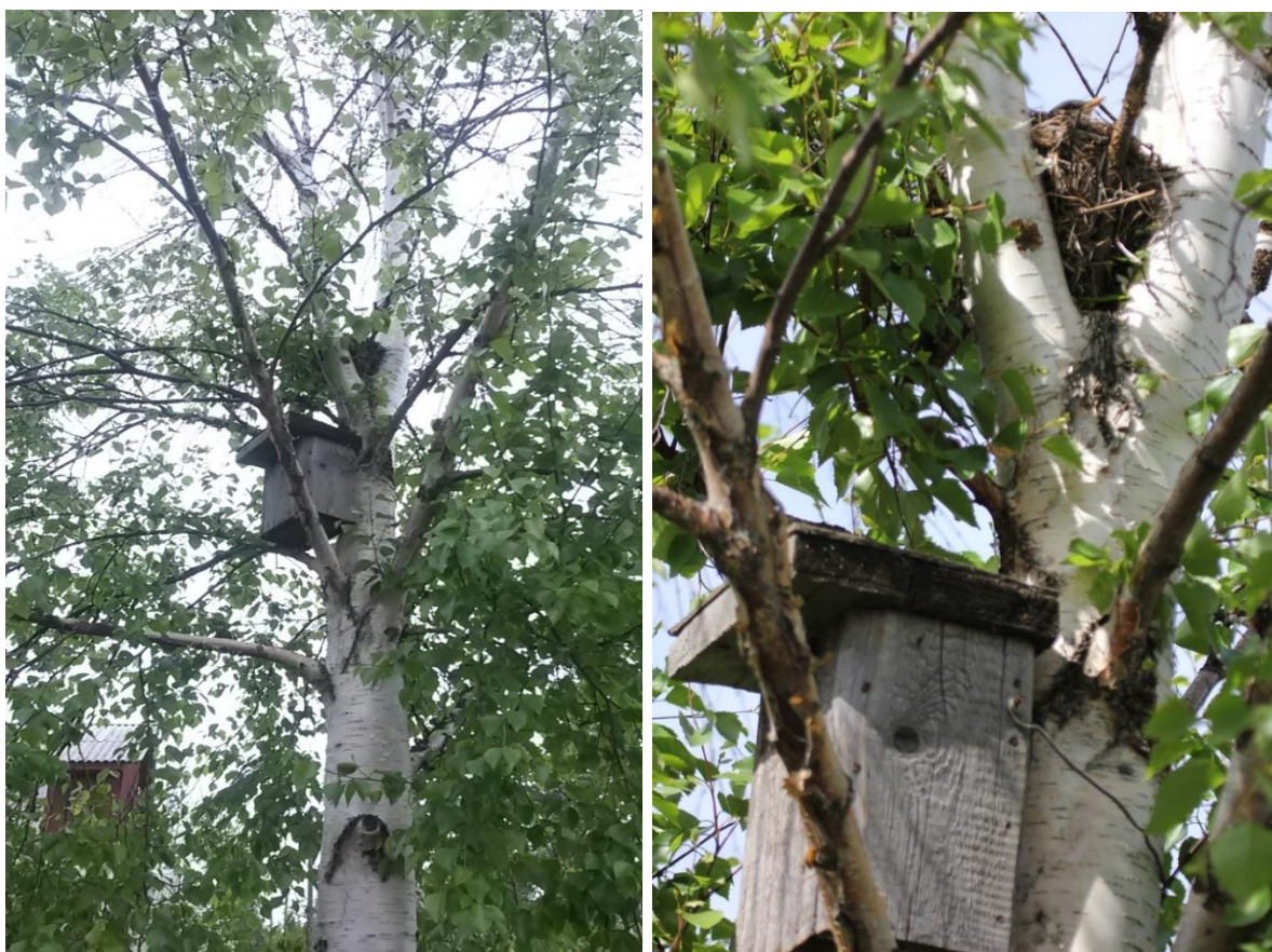
Рис. 1. Расположение гнёзд рябинника Turdus pilaris и большой синицы Parus major на одной берёзе. Окрестности Архангельска. 5 июня (слева) и 14 июня (справа) 2019. Здесь и далее фото автора.

В мае 2019 года на моём дачном участке под Архангельском в синичнике, расположенном на берёзе, как обычно загнездилась пара больших синиц Parus major (Андреев 2018). В начале июня у синиц вылупились птенцы. В эти же дни рябинники Turdus pilaris построили гнездо в развилке берёзы всего в 40 см над синичником (рис. 1).