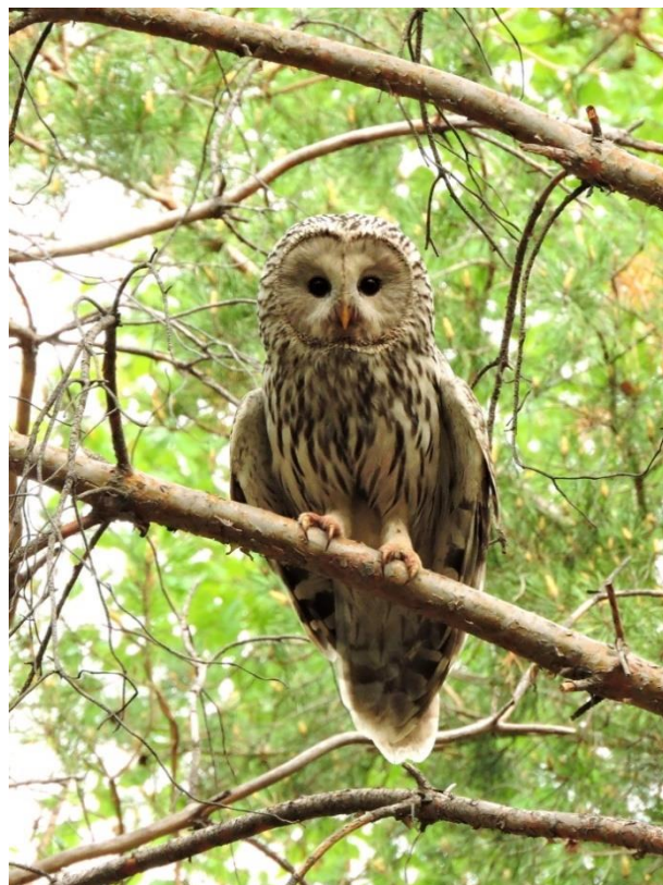
Рис. 1 (слева). Гнездо длиннохвостой неясыти Strix uralensis в сосновых посадках 30-40-летнего возраста у села Старая Лебежайка. 11 мая 2019.