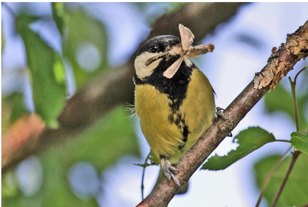
Рис. 4. Самка большой синицы Parus major с кормом около синичника. Окрестности Архангельска. 14 июня 2019.

этих видов проходило в разные сроки: подросшие птенцы синицы вылетели из гнезда, а рябинники начали выкармливать птенцов. В итоге обе пары – больших синиц и рябинников – благополучно вывели и выкормили птенцов на одном дереве в течение одного месяца.