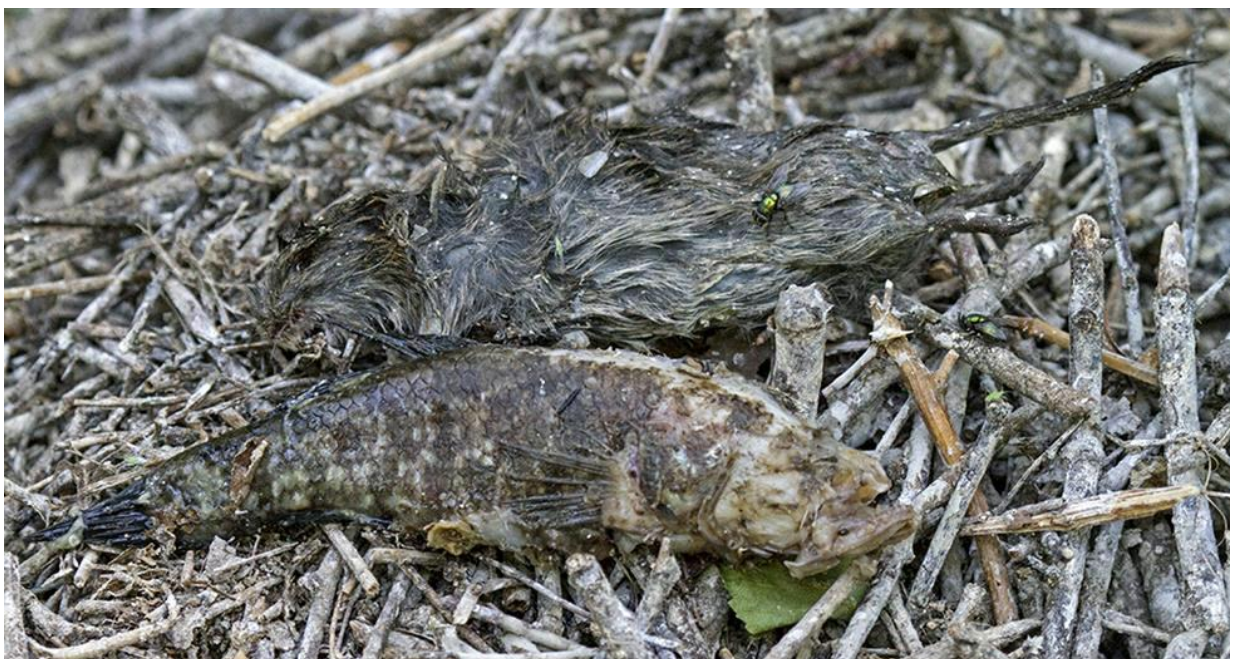
Рис. 11. На первом плане ротан, на втором плане тушка полёвки Microtus sp. 14 июня 2017.

Исходя из анализа собранного материала можно заключить, что серые цапли в наблюдаемой колонии в гнездовой период чаще добывают карасей (рис. 8), являющихся доминантным по численности видом рыб во всех водохранилищах, где цапли добывают корм. Несколько реже цапли добывают ротанов (рис. 10) и вьюнов (рис. 9). Только по одному экземпляру найдены мелкие млекопитающие – полёвка (рис. 11) и детёныш ондатры.