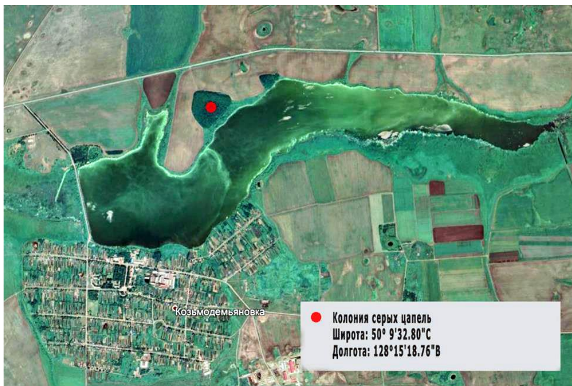
Рис. 1. Месторасположение гнездовой колонии серых цапель у села Козьмодемьяновка Тамбовского района (Копия Google Earth Pro).

Отдельными особями и небольшими по численности группами растёт лимонник китайский Schisandra chinensis , лианы которого оплетают стволы и ветви деревьев до высоты второго яруса древостоев.