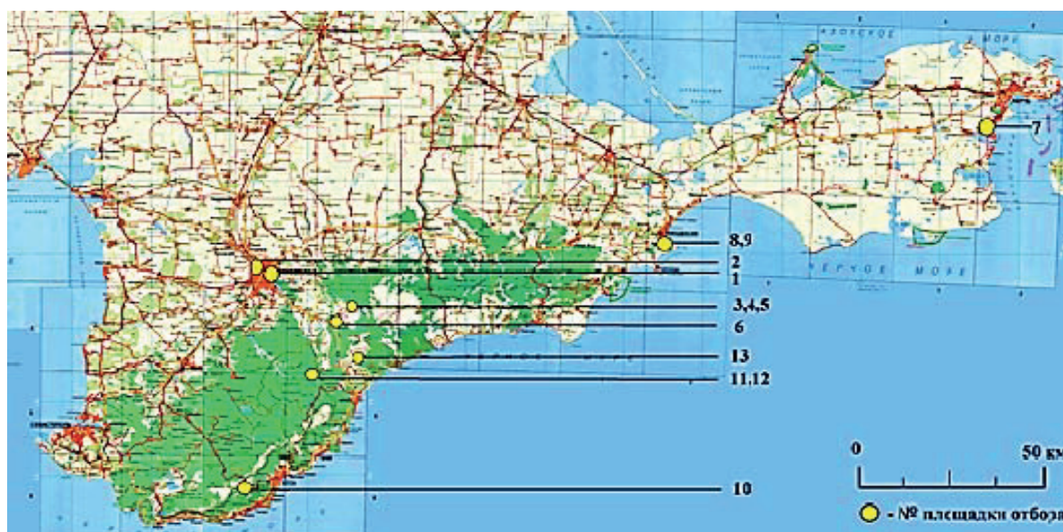
Рис. 1. Расположение площадок отбора проб лишайников на территории Республики Крым