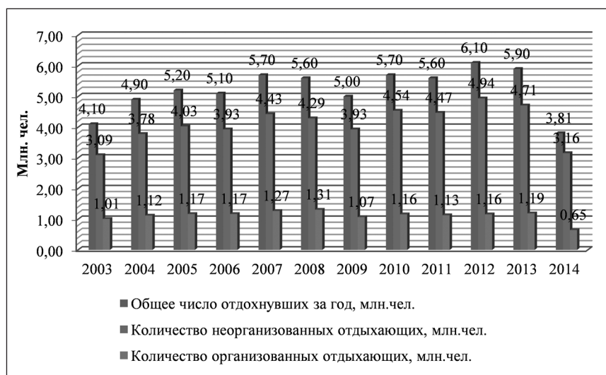
Рис. 1. Динамика числа туристов в Республике Крым в 2003–2014 гг., млн. чел.

Для обеспечения комфортного отдыха на территории Республики Крым требуется развитие и модернизация транспортного комплекса, обеспечивающего перевозку пасса-