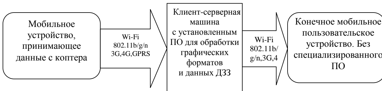
Рис. 4. Блок-схема коммутации полученных данных ДЗЗ с сервером и конечными пользователями

В случае использования схемы, представленной на рис. 4, идеальным вариантом является тот, когда на принимающем мобильном устройстве есть предустановленные программы, которые обеспечивают первоначальную обработку данных дистанционного зондирования (например, открывающие эти данные и расставляющие пометки, комментарии, опорные точки, выделяющие места и зоны чрезвычайных ситуаций). Связь с мобильным устройством может осуществляться при помощи встроенного в него Wi-Fi, либо модуля, обеспечивающего доступ к Интернету через сети 3G, 4G, GPRS и др. На клиент-серверной машине должны быть установлены программы глубокой обработки данных (различные ГИС, специализированные графические редакторы), обеспечивающие возможность охвата большого количества конечных пользователей.