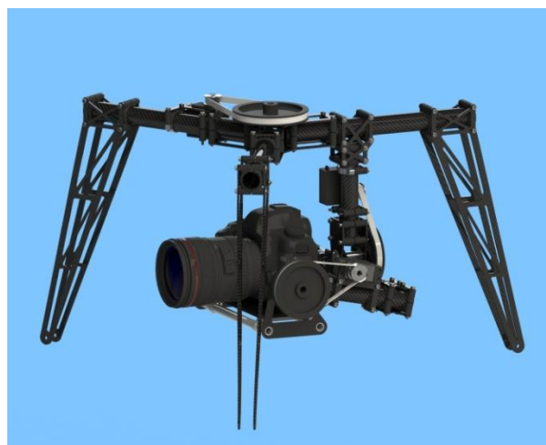
Рис. 2. Подвес топокоптера с фотокамерой