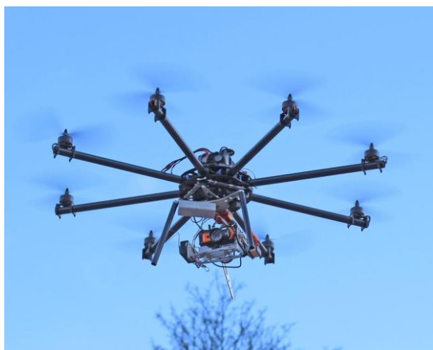
Рис. 1. Топокоптер «Дредноут» в работе

Для указанных целей в полезную нагрузку многороторного аппарата, размещаемую на трехосевом подвесе с возможностью управления камерой оператором, могут входить: цифровая фотокамера (видеокамера) телевизионной системы (рис. 2), тепловизор, инфракрасная камера, локационное оборудование (например, эхолот), счетчик Гейгера или другие датчики для экологического мониторинга.