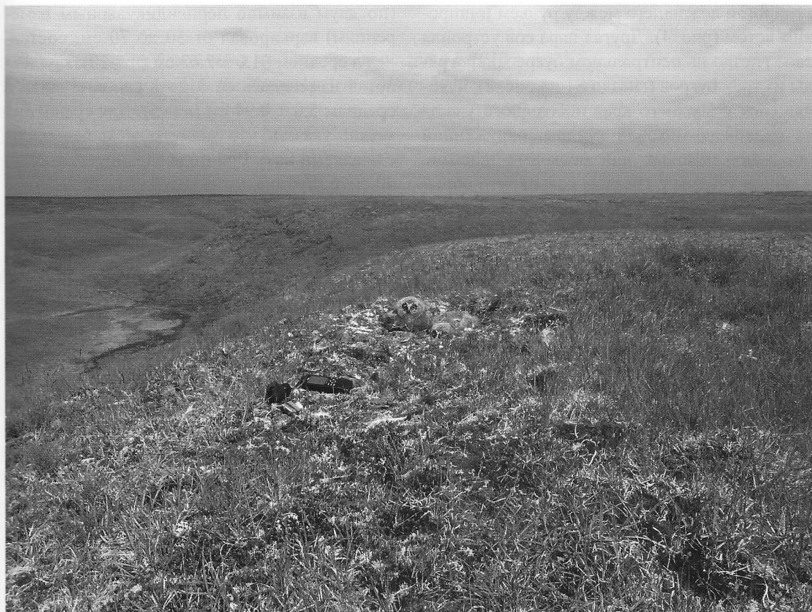
Рис. 5. Высокое местоположение гнезда белой совы (на краю берегового склона) Fig. 5. High location of the Snowy Owl nest (on the edge of the creek slope)

ли на небольшом участке площадью не более 4 км 2 . Через день, 14.07, с той же точки учтены всего 2 нетерриториальные птицы, а 16.07 — единственный самец. При обследовании 18.07 наиболее отдалённого от лагеря участка района работ вокруг горы Верхняя Хэйяха (320 м над ур. м.) встречены 6 бродячих белых сов, из которых 5 особей (2 самца и 3 самки) сидели в непосредственной близости друг от друга среди камней у нижнего края снежника под крутым каменистым склоном гряды Пай-Хоя.