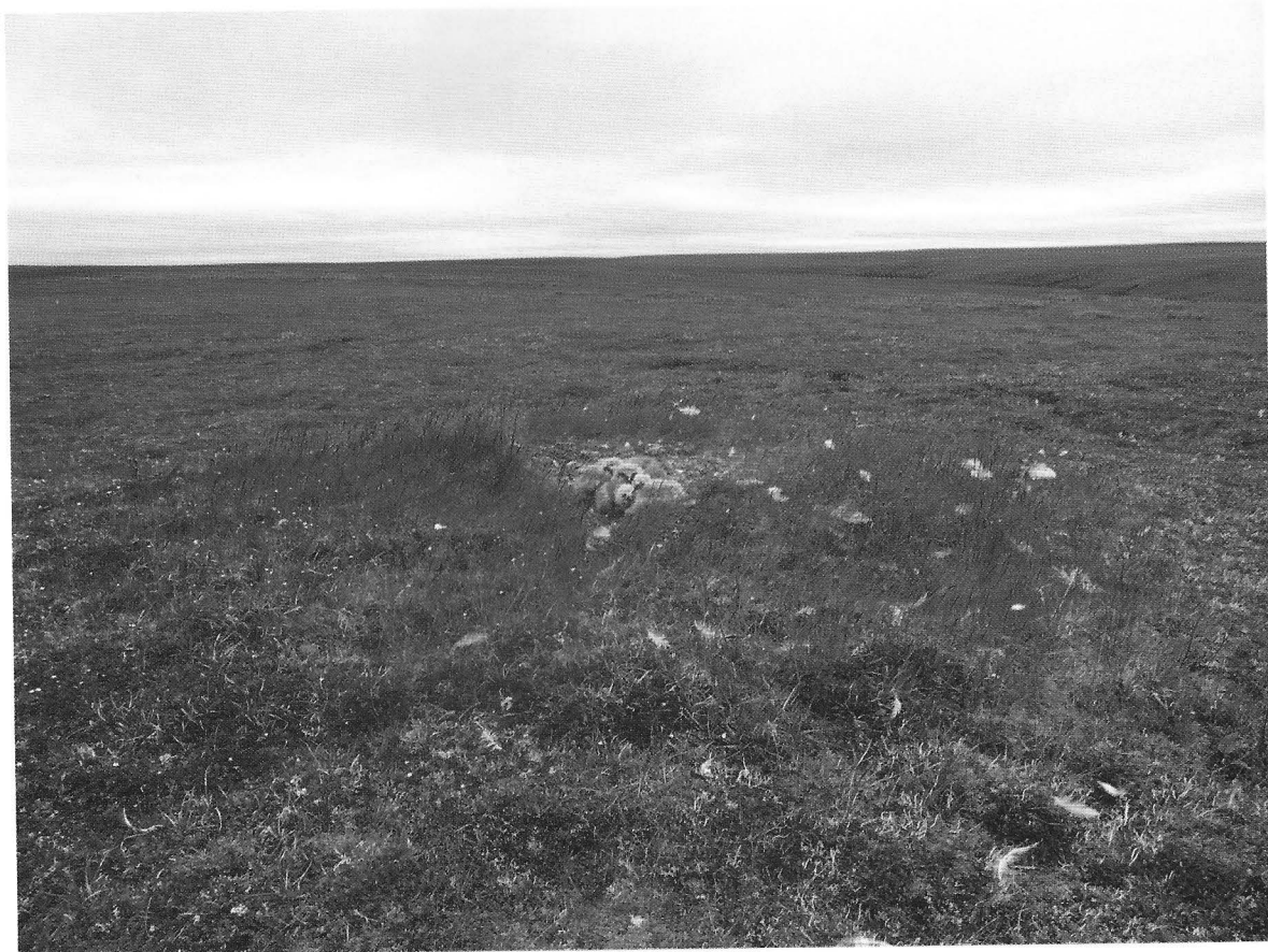
Рис. 4. Низкое местоположение гнезда белой совы Fig. 4. Low location of the Snowy Owl nest

ровностями рельефа. Критерием определения допустимого для наблюдения за гнездом расстояния служило поведение взрослых птиц: если самка возвращалась к гнезду для охраны птенцов и чтобы покормить их, дистанция для проведения считалась приемлемой, если нет, дистанция увеличивалась, либо наблюдения прекращались.