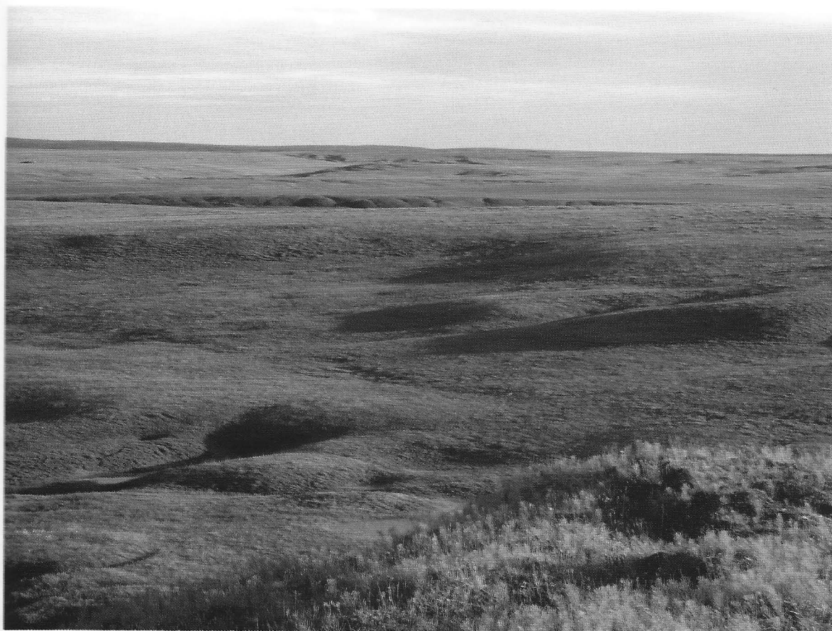
Рис. 3. Ландшафт района работ Fig. 3. Landscape of the study area

или песчано-гравийной смесью и покрыты, в зависимости от условий дренажа, дриадово-осоково-моховыми или осоково-моховыми тундрами, в наиболее пологих местах с плохим дренажом — сырыми осоково-моховыми ивняками или осоково-пушициевыми болотами. Ивовые кустарники в таких сообществах невысокие, не выше 30 см, лишь кое-где, по соседству с каменистыми россыпями гряд, высота кустов может достигать 50 см. Такие же болота занимают плоские днища речных долин и берега термокарстовых озёр, разбросанных по террасам Хэйяхи и местами по выположенным участкам водоразделов. Бровки речных долин и песчано-гравийные останцы покрыты сухими тундрами, где доминируют стелящиеся ивки ( Salix nummularia , S. polaris ) или дриада.