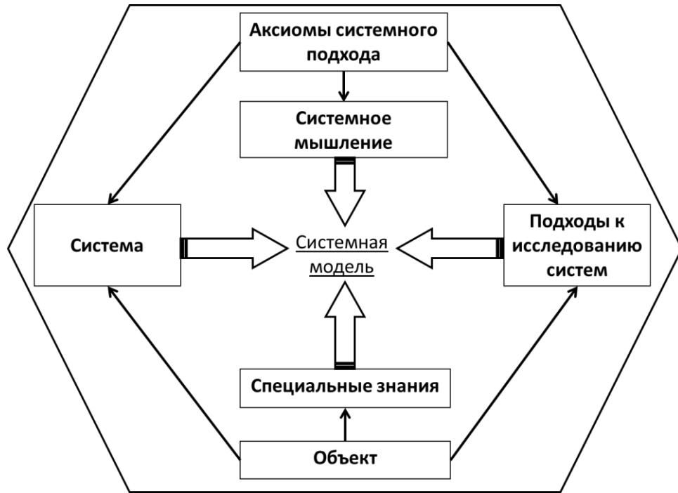
Схема 1. Компоненты системного исследования.

В качестве первого компонента, лежащего в основе системного исследования, можно выделить ряд аксиом или основополагающих положений, которые рассматриваются системными исследователями в качестве очевидных и не требующих доказательств. Данные аксиомы представляют собой положения мировоззренческого характера, помогающие исследователю ориентироваться в мире реальных вещей и ментальных конструкций, а также искать в нем системы, замечать закономерности их функционирования и взаимодействия. К аксиомам, лежащим в основе системного подхода можно отнести следующие семь положений.