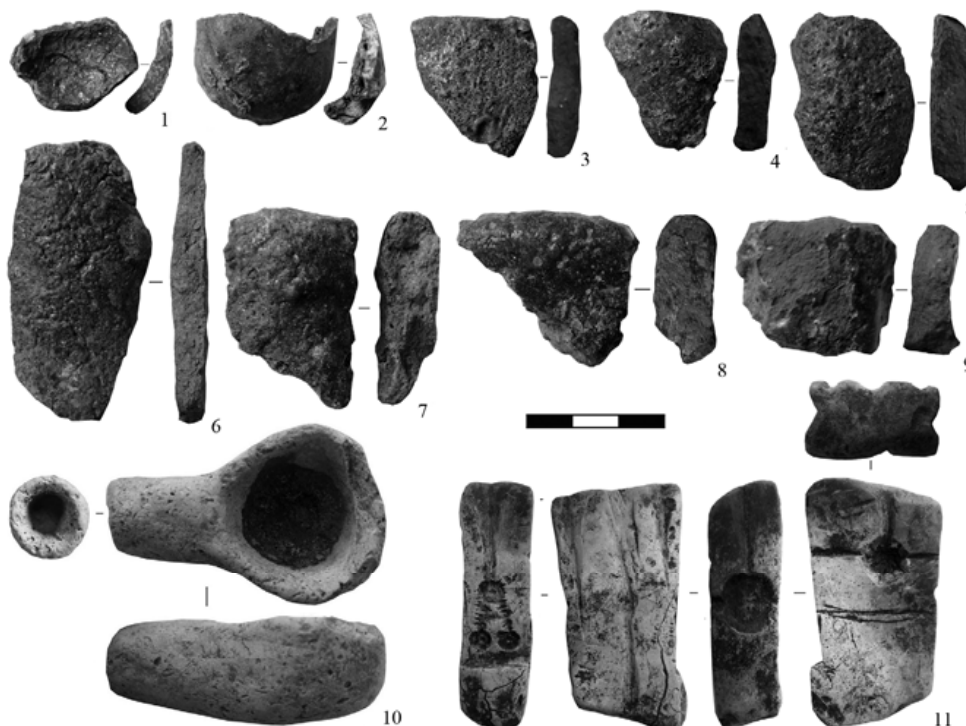
Рис. 2. Кушманское городище Уччакар. Литейный инструментарий внешней части. 1–9 – фрагменты тиглей; 10 – льячка; 11 – форма литейная. Материал: 1–10 – глина; 11 – камень.

Учетные обозначения: 1 – 1022, уч. DK 27, гл. 16160; 2 – 1060, уч. DK 27, гл. 16160; 3 – 1059, уч. DH 25, гл. 16125; 4 – 937, уч. DJ 25, гл. 16135; 5 – 992, уч. DJ 28, гл. 16169; 6 – 2455, уч. DJ 27, гл. 16098; 7 – 2771, уч. DI 25, гл. 16029; 8 – 3328, уч. DI 25, гл. 16039; 9 – 1026, уч. DJ 26, гл. 16142.