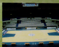
БК "Динамо", г. Москва