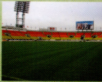
Стадион "Петровский", г. Санкт-Петербург