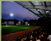
Стадион "НАРА", г. Наро-Фоминск