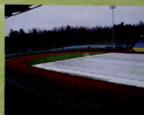
Стадион "Зоркий", г. Красногорск